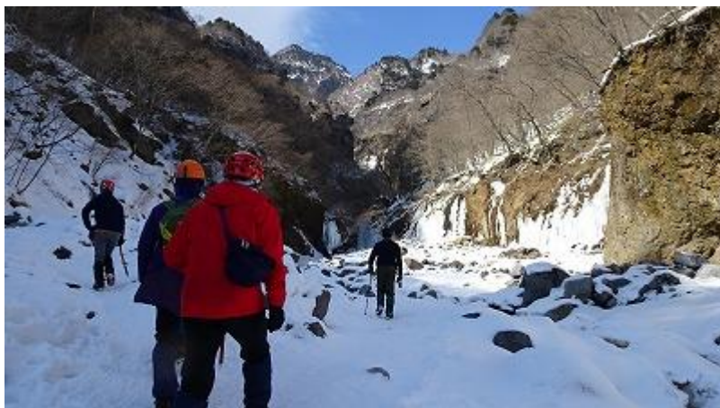
溪谷を登っていくと、氷瀑が現れ始めた。