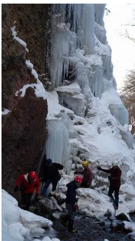
数回渡渉する。足下は凍っており、アイゼンをしっかり効かせて慎重に進む。