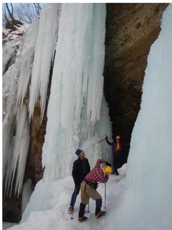
巨大な氷瀑の真下でパチリ。