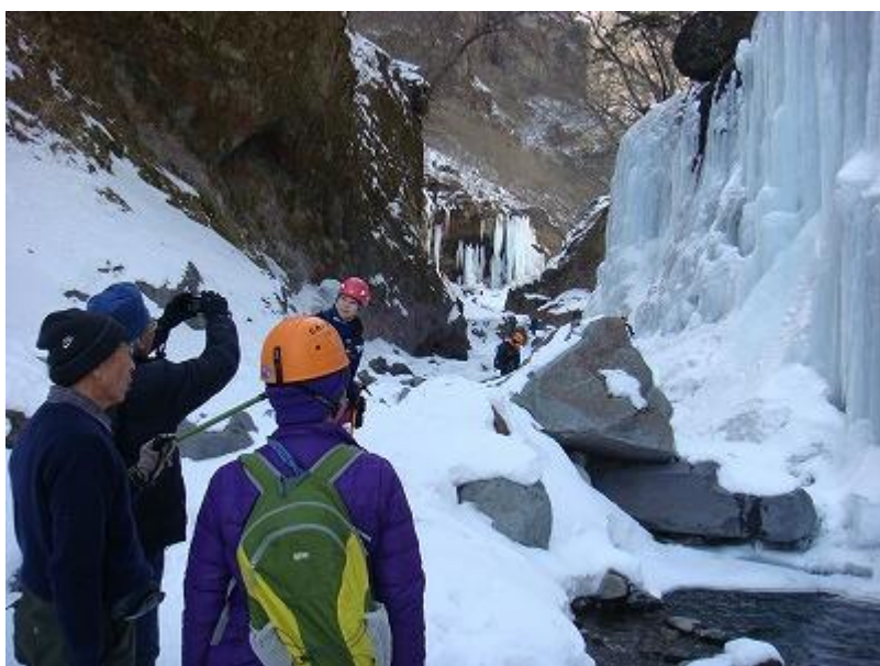
次第に溪谷が狭まり、氷瀑の規模が大きくなって来た。